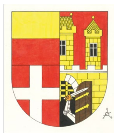
◀ Variantní návrh znaku Městské části Praha - Dolní Měcholupy