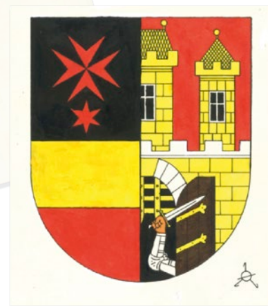
▶ Finální návrh znaku Městské části Praha - Dolní Měcholupy

Tento závazný popis tzv. "blason", který nelze měnit, zní: