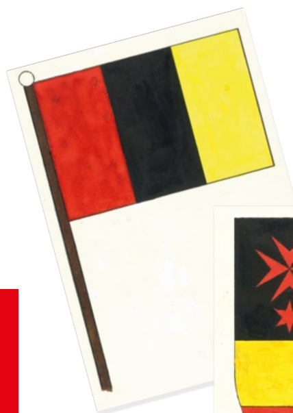
◀ Finální návrh praporu Městské části Praha - Dolní Měcholupy