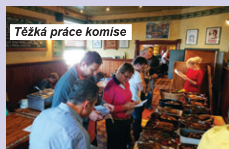
Těžká práce komise