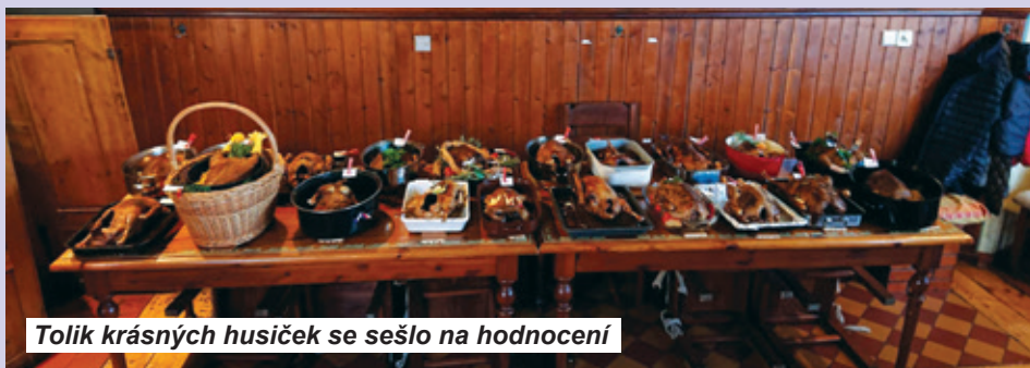
Tolik krásných husiček se sešlo na hodnocení

V neděli 11. 11. 2018 proběhl 4. ročník soutěže o nejlepší Svatomartinskou husu s ochutnávkou Svatomartinských vín. Děkujeme všem soutěžícím za účast, porotě za hodnocení a také Vám všem, kteří jste akci navštívili. Vítězům srdečně gratulujeme! Poděkování patří také všem dobrovolníkům, kteří se podíleli na přípravě a realizaci akce. K poslechu hrála kapela Galaxis band, atmosféra byla velmi příjemná a přátelská.