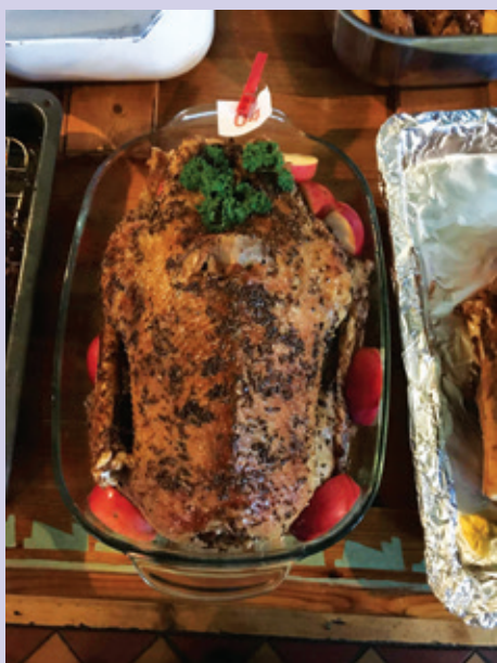
A to je ona! - vítězná Svatomartinská husa 2018

*V případě shodného počtu bodů rozhodlo o pořadí bodové hodnocení v kategorii chut'