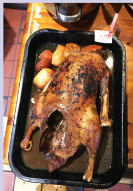
Třetí husa svedla těžký boj.