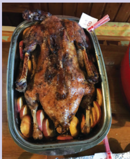
Druhá nejlepší husa