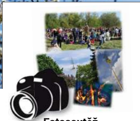
Fotosoutěž str. 17