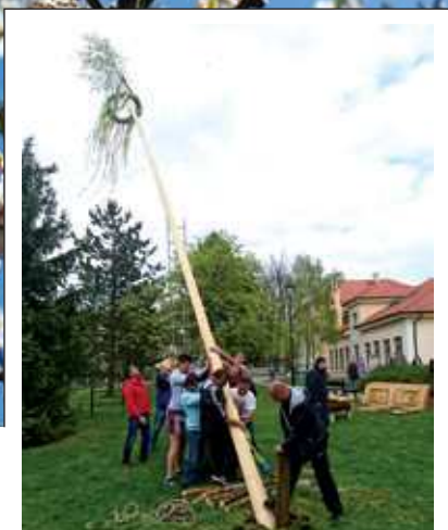
Májka a čarodějnice str. 14