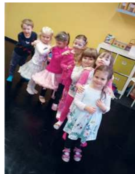
I nejmenší tanečníci nacvičují