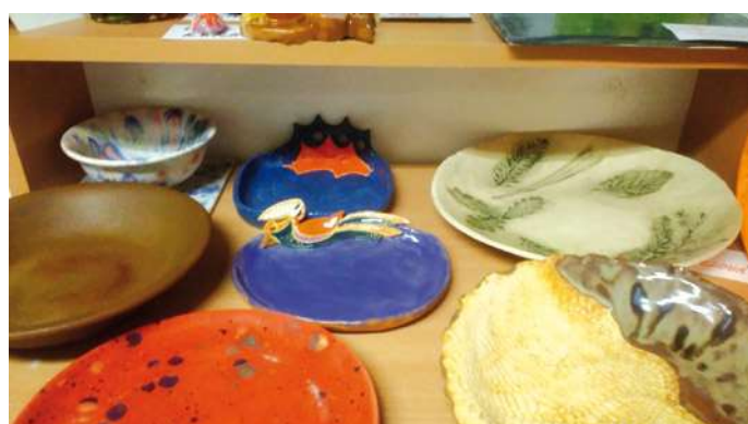
Naše keramičky seniorky a ukázka jejich tvorby