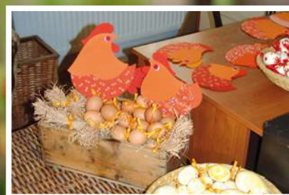
Hody, hody - naše Velikonoce! ... str. 11