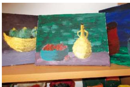
Atelier 2., první pokus o zátiší, dětí 7-10 let

V pátek 7. 4. 2017 se rozloučíme se zimou – Vynášení Morany začne v 15:30 u Leonarda. V průběhu procházky si zahra-