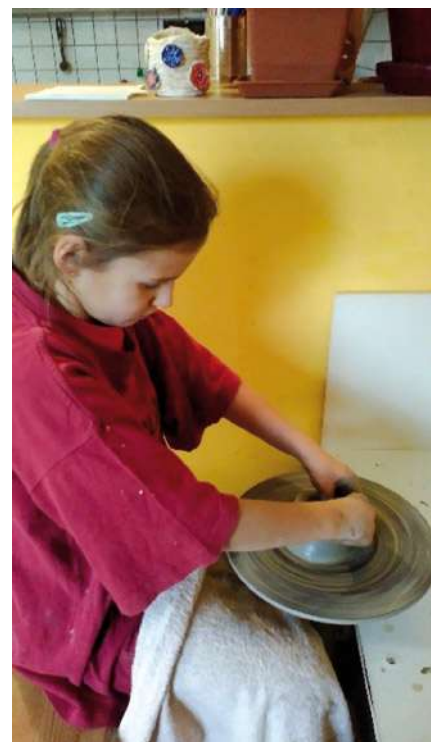
Keramika 3, točíme na elektrickém kruhu, dětí 6-8 let

Na měsíc květen i letos plánujeme Hry pod májkou – tradiční soutěžní odpoledne pro nejmladší děti od 2 do 6 let. Přesný termín najdete na našem webu. Soutěže pro děti připravujeme také v rámci oslav Dne dětí v neděli 28. 5. 2017 na fotbalovém hřišti. Můžete se těšit i na vystoupení roztleskávaček Green Angels .