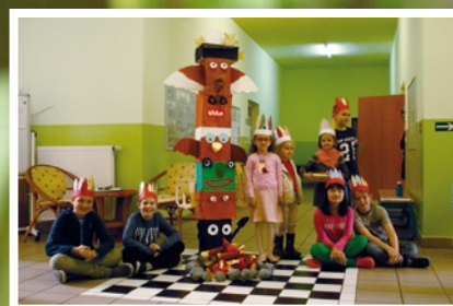
Indiánský zápis do 1. ročníku ... str. 9