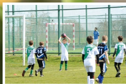
Velikonoční turnaj dětí ve fotbale ... str. 4