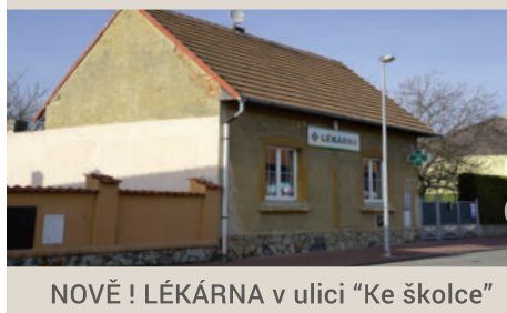
NOVĚ ! LÉKARNA v ulici "Ke školce"