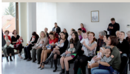
I v tomto roce bude VÍTÁNÍ OBČÁNKŮ