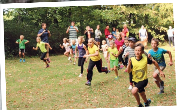
Obecní úřad - 1. ročník závodu „VELKÁ ĚCHOLUPSKÁ“