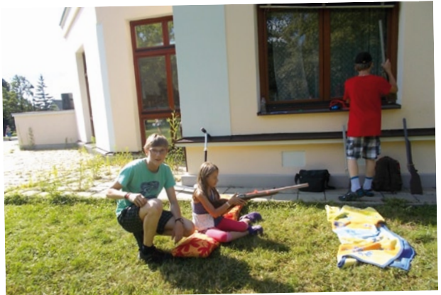
Leonardo - 10. Tarzan - sportovní odpoledne