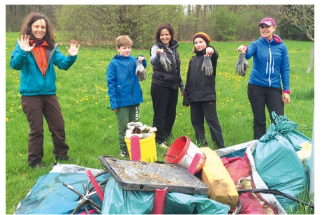
Leonardo - Uklidíme Česko