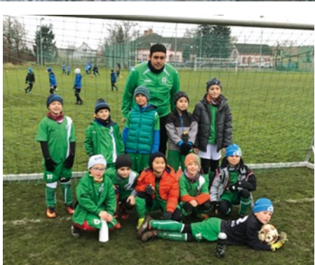
SK Dolní Měcholupy - Mikulášský turnaj