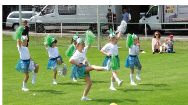
Leonardo - Dětský den