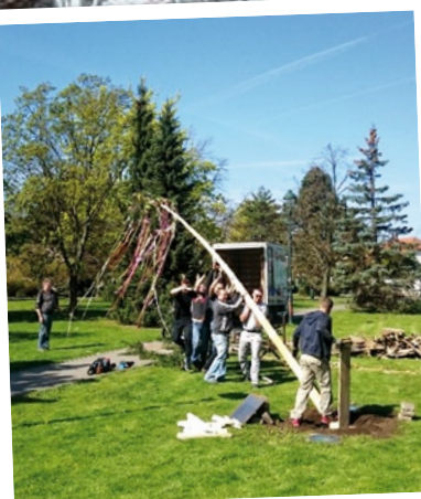
Obecní úřad - Stavění májky