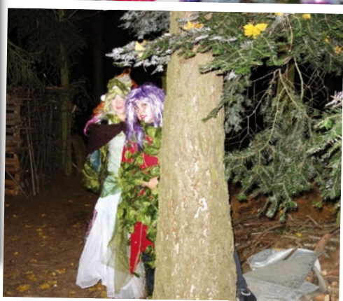
Leonardo - Les duchů