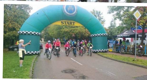
Měcholupská šlapka - veřejná aktivita