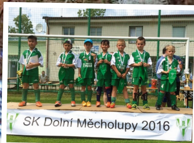
SK Dolní Měcholupy - Pohár starosty