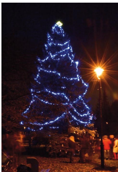
Obecní úřad - První adventní neděle