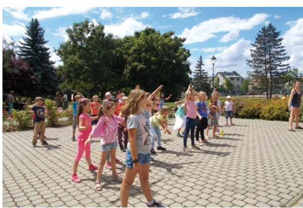
Leonardo - slavnostní odtančení školního roku