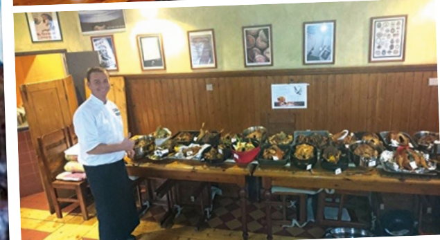
Obecní úřad - soutěž o nejlepší husu