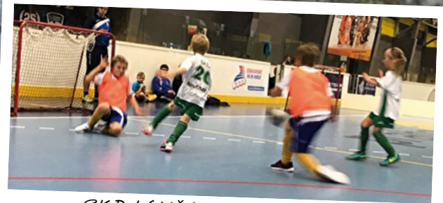
SK Dolní Měcholupy - Poslední turnaj