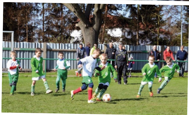
SK Dolní Měcholupy - Velikonoční turnaj